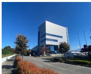
情報創造館庁舎5階