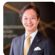
▲ EY wavespace 天野

戦略コンサルティング領域とマーケティング・ブランディング領域の双方に従事してきた経験を基に、異なる機能・方針が必要となるビジネスの「深化」と「探索」の二つを結ぶ。エグゼクティブブリーフィング部門のヘッドとしてセッションを数多くリードしてきた。