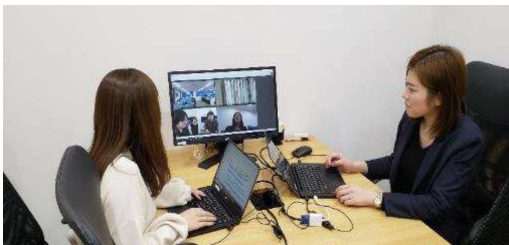
静岡市内のシェアオフィスで東京と同様の業務を行うスタッフ