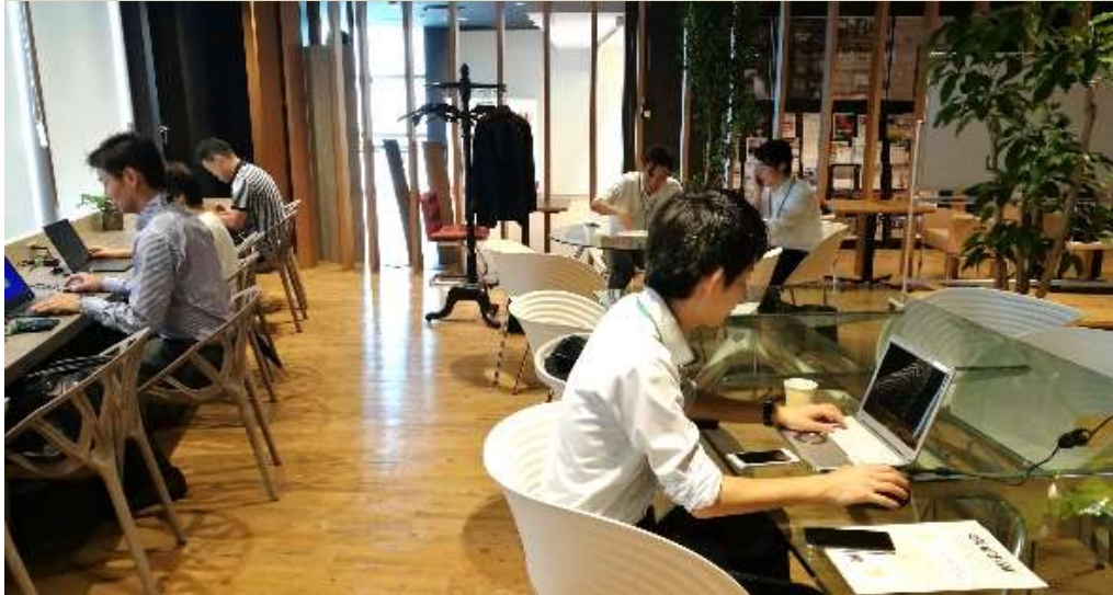
首都圏企業社員様による駅周辺施設での「お試しテレワーク」体験