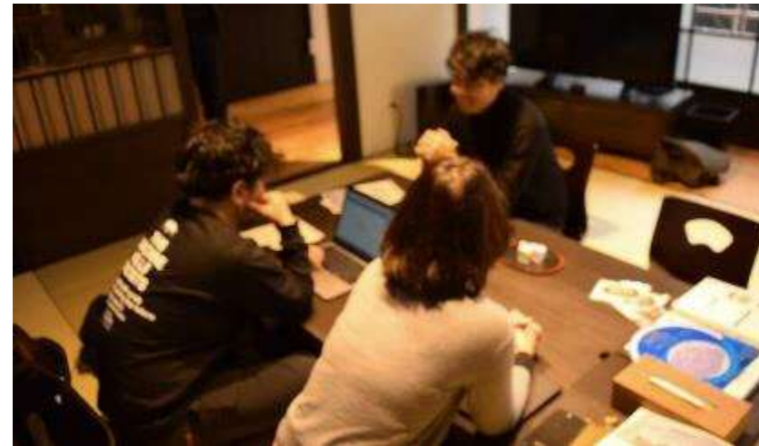
引き続き本市へのテレワーカー移住を促進