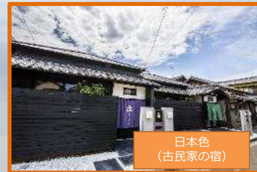
日本色 (古民家の宿)