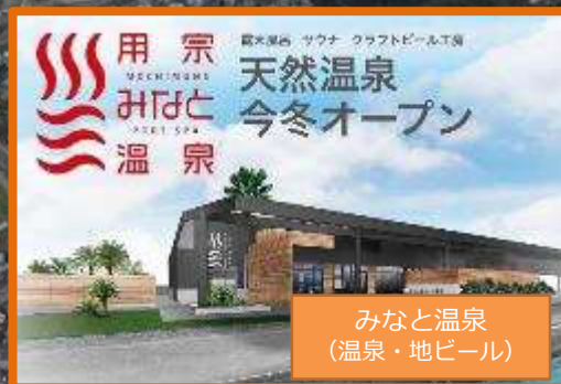
みなと温泉 (温泉・地ビール)