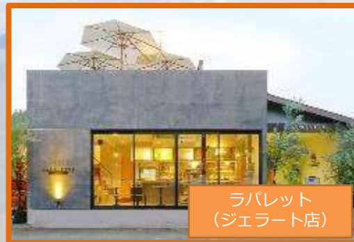
ラパレット (ジェラート店)