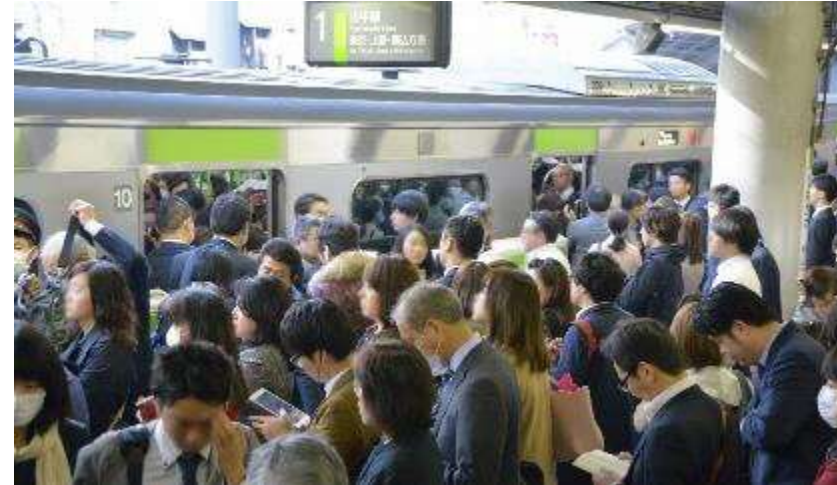
首都圏での交通混雑緩和のためテレワークを活用