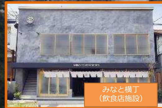
みなと横丁 (飲食店施設)