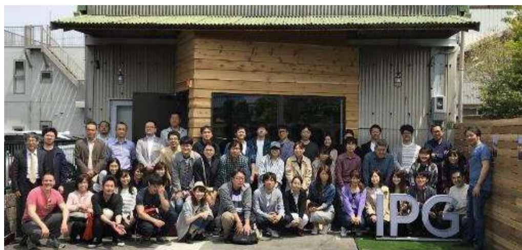
タコの加工を行っていた倉庫をリノベーションしたIPG用宗オフィス