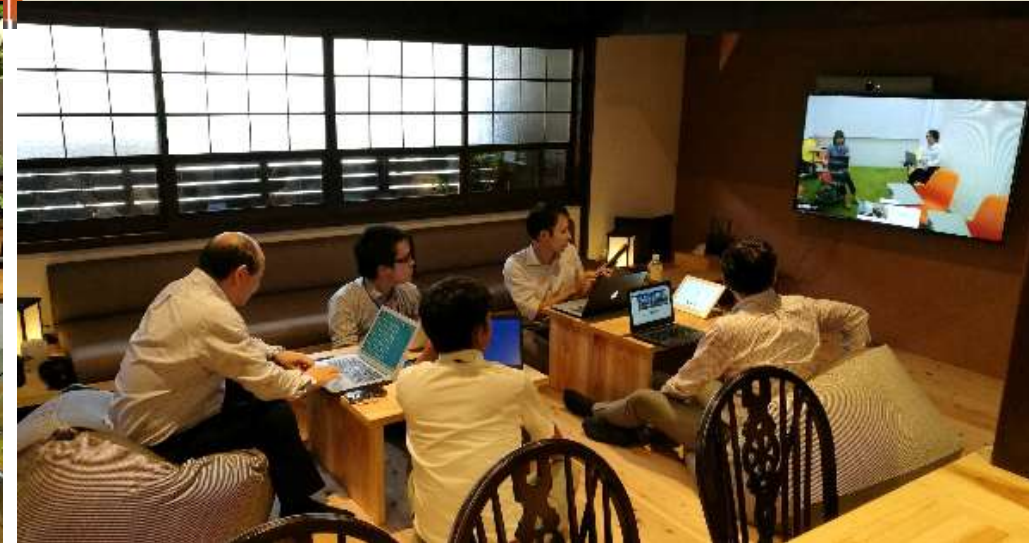
リノベーション古民家を活用した「ワーケーション」実証