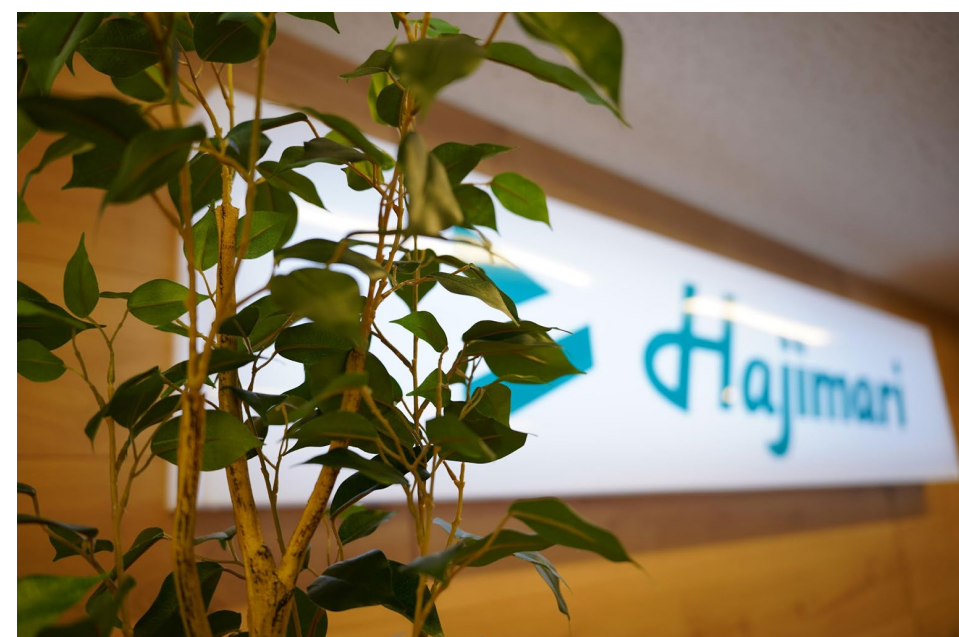
2023年1月 20人収容できるスペースの取れる R-DEPOTに移転