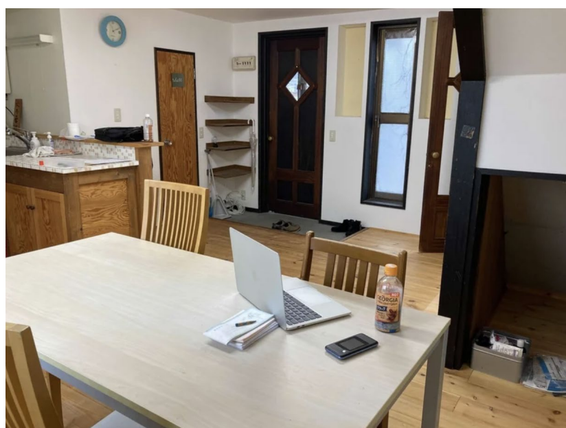
2022年3月 ユニットバス付きワンルーム からスタート